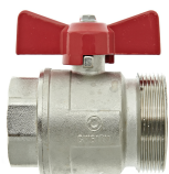
Арт. 50501 Шаровой клапан 2" 1 1/2" ВР x 2" НР, плоская прокладка