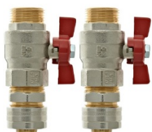
С запорными клапанами