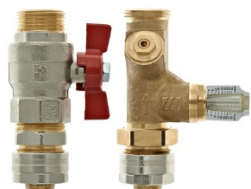
С запорным и балансировочным клапанами